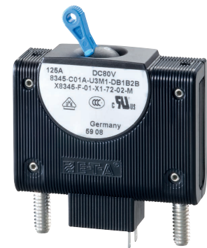
Hydraulisch-magnetischer Schutzschalter Typ 8345 + X8345-F (Fernauslösespule)