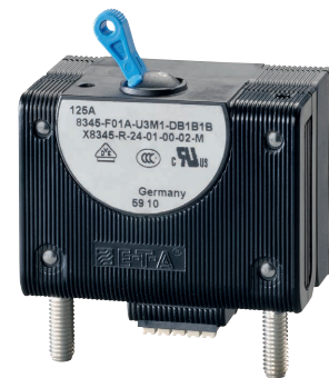
Hydraulisch-magnetischer Schutzschalter Typ 8345 + X8345-R (Feinein- und Fernauslösemodul)